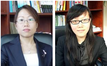
경염동 중국변호사 부응 중국변호사