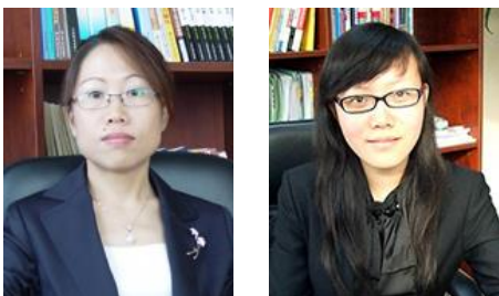
경염동 중국변호사 부응 중국변호사