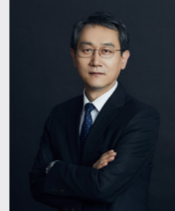
오자성 안전 · 중대재해