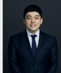
김광의 ESG 평가 대응 · ESG 데이터 분석