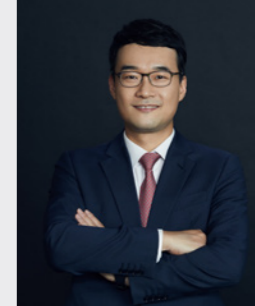
이태현 바이오 · 헬스케어