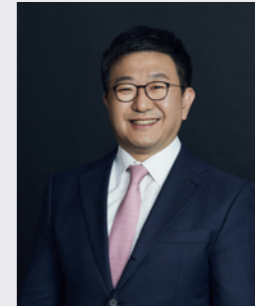
신민 M&A · 기업지배구조