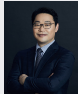
장영은 공시 · 상장회사