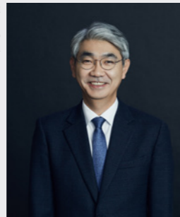
윤영규 금융회사 지배구조