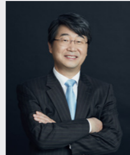
김지형 노동 · 산업재해 · 컴플라이언스