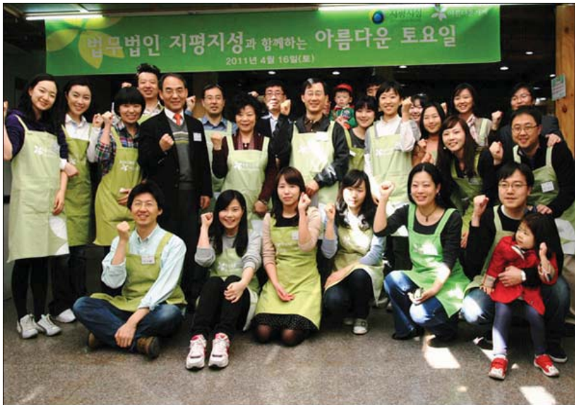
법무법인 지평지성과 함께하는 아름다운 토요일 (2011. 4. 16.)