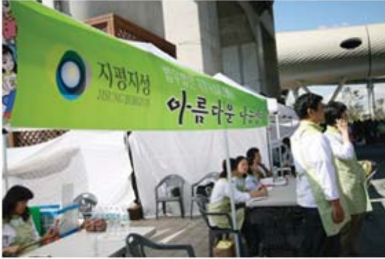
'도전! 뷰티풀 그린벨' 행사 부스