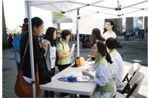
'도전! 뷰티풀 그린벨' 참가자 접수