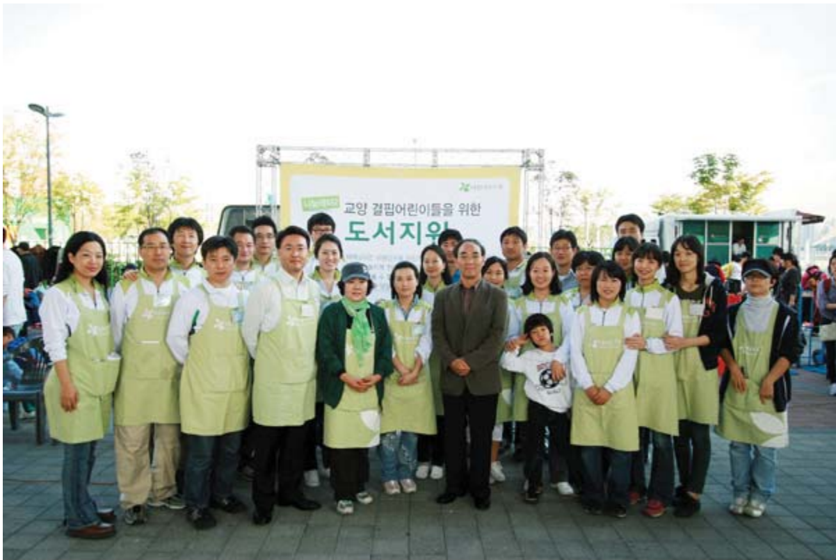
법무법인 지평지성 · 아름다운 나눔장터, '도전! 뷰티풀 그린벨' 개최 기념사진 (2010. 10. 9.)