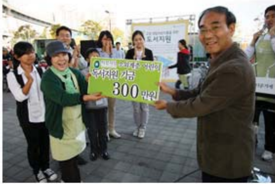
'도전! 뷰티풀 그린벨' 우승자의 소외계층 어린이 도서지원 기금 전달