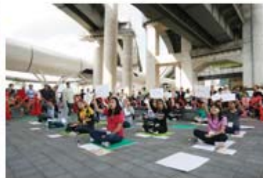
'도전! 뷰티풀 그린벨' 행사 진행