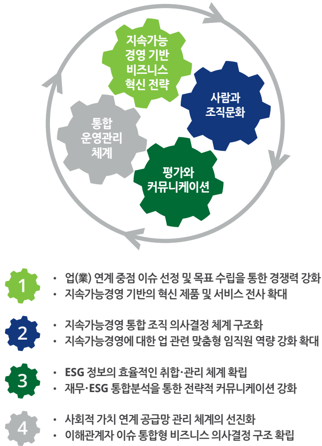
그림 2. 핵심 동력 확보를 위한 국내 기업의 주요 과제