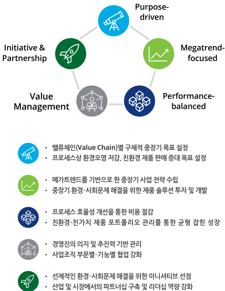
그림 3. ESG 경영 패러다임의 전략 핵심 요소 5가지

혁신 기업들의 경영 전략은, 그림 3에서 보듯이 5가지 전략 요소를 특징으로 한다. 이는 1) 명확한 목표 설정(Purpose-driven), 2) 환경·사회 메가트렌드 분석을 통한 비즈니스 전략 연계(Megatrend-focused), 3) 리스크-기회 관점의 전략 및 운영 성과 관리 통합, 4) 조직 간 협업(Cross-functional Collaboration) 활성화 및 그에 대한 의사결정 구조 수립, 5) ESG 관점의 글로벌 이니셔티브 및 파트너십에 대한 리딩 포지션(Leading Position)이다.